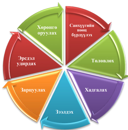
Зураг 2-3 Хувь хүний санхүүгийн төлөвлөлтийн бүрэлдэхүүн хэсэг 8

Санхүүгийн нөөц бүрдүүлэх: Та ажил хөдөлмөр, бизнес эрхлэх болон хөрөнгө оруулалт хийх замаар санхүүгийн нөөц эх үүсвэрээ олж авдаг. Санхүүгийн нөөц эх үүсвэр бүрдүүлэх нь санхүүгийн төлөвлөлтийн үндэс суурь болох бөгөөд энэ үеэс л санхүүгийн үйл ажиллагаа идэвхждэг.