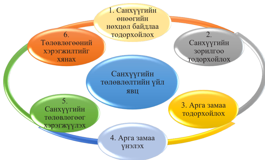
Зураг 2-1 Санхүүгийн төлөвлөлтийн үйл явц 5

Зураг 2-1-д харуулж буй өөр хоорондоо уялдаа холбоо бүхий санхүүгийн төлөвлөлтийн үйл явц амьдралын ямар ч нөхцөл байдалд нийцнэ.