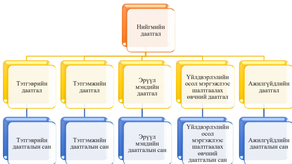
Зураг 15-1 Нийгмийн даатгалын төрөл ба сан

Нийгмийн даатгал нь 5 төрөлтэй бөгөөд төрөл тус бүр бие даасан сантай байна. (Зураг 15-1-ийг харна уу). Нийгмийн даатгал нь бусад даатгалын адил заавал ба сайн дураар даатгуулах гэсэн хэлбэртэй байна.