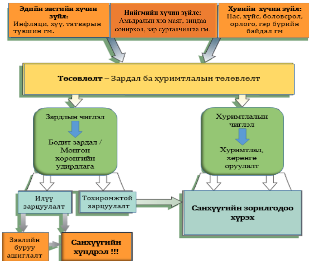
Зураг 12-1 Худалдан авалтын шийдвэр санхүүгийн байдалд нөлөөлөх нь 64

Худалдан авалт нь харьцуулсан ба гэнэтийн гэсэн үндсэн хэлбэртэй.