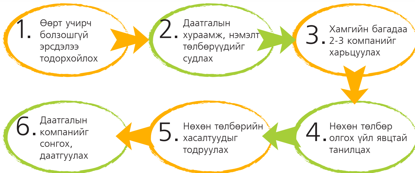
Зураг 1. Даатгалын бүтээгдэхүүн авахад анхаарах зүйлс