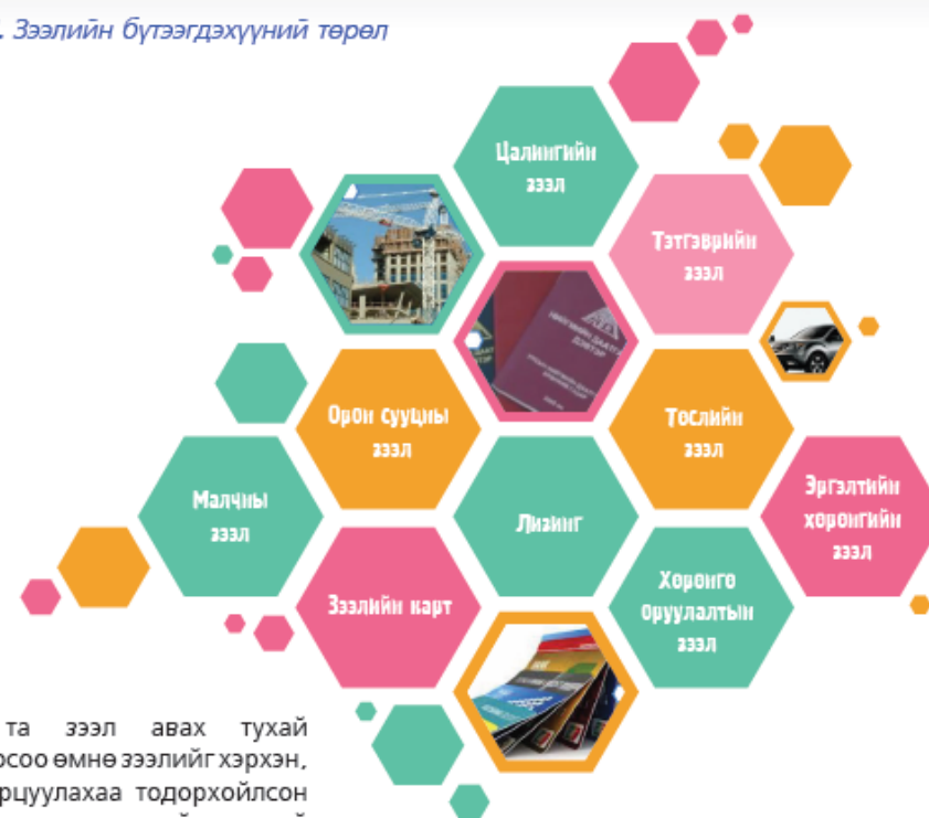
Зураг 1. Зээлийн бүтээгдэхүүний төрөл

Иймд та зээл авах тухай бодохоосоо өмнө зээлийг хэрхэн, юунд зарцуулахаа тодорхойлсон байхаас гадна зээлийг хүүний хамт тогтмол давтамжтайгаар буцаан төлөх ирээдүйн орлогоо тооцоолсон байх ёстой.