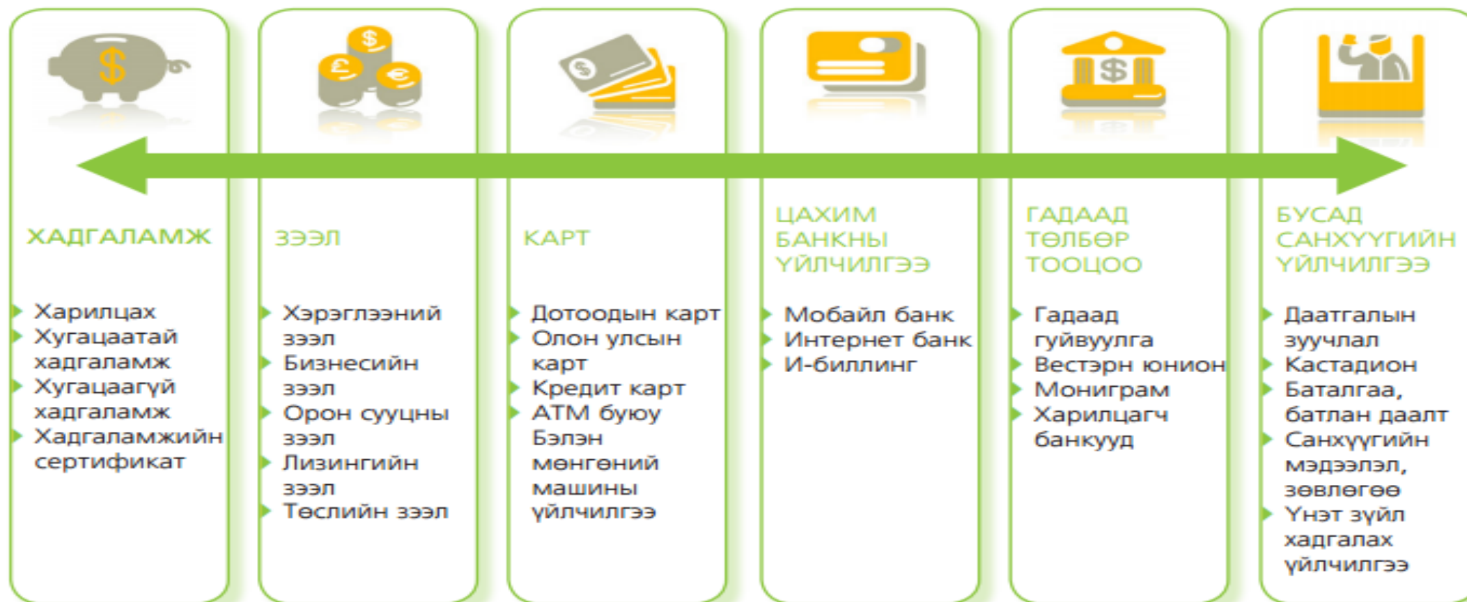
Зураг 1.4 Банкны бүтээгдэхүүн үйлчилгээний төрөл