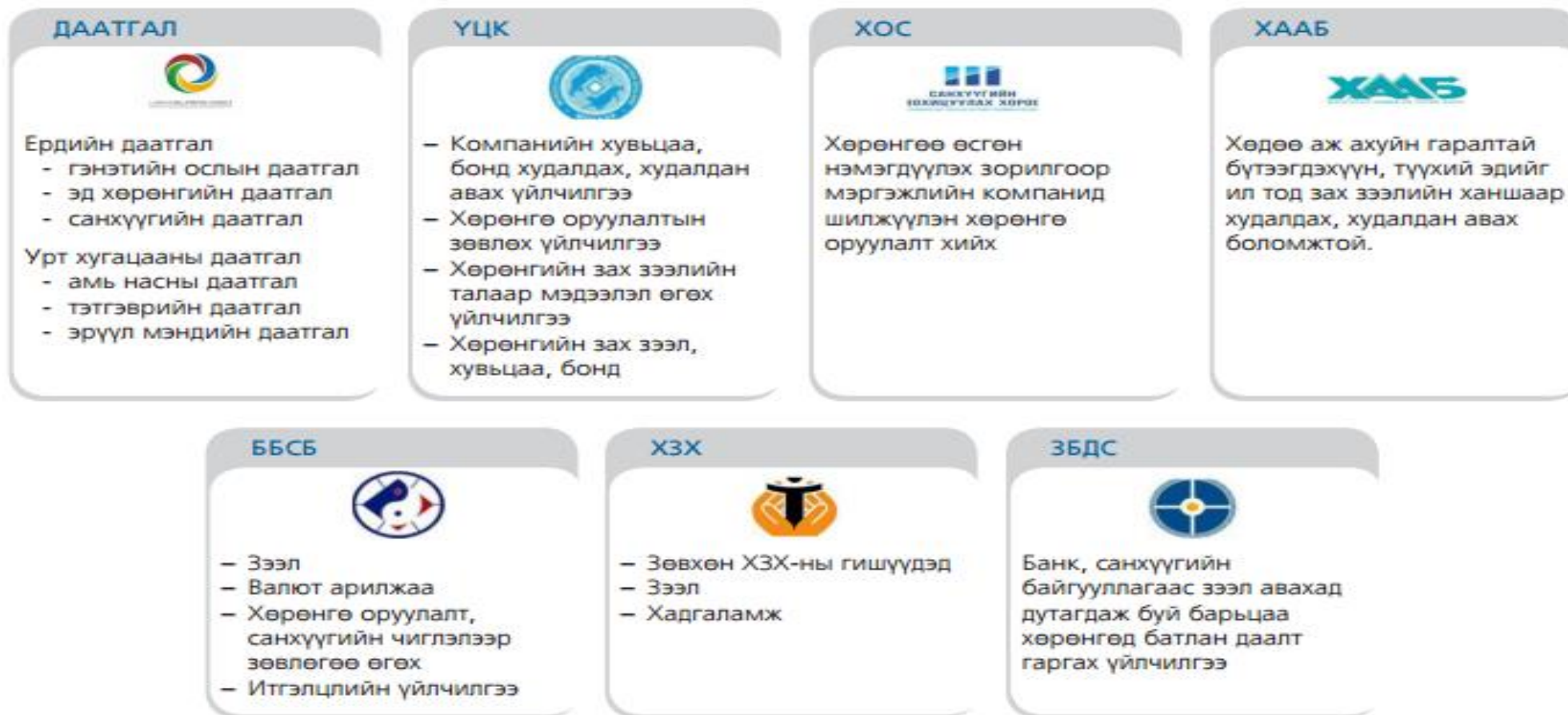
Хүснэгт 1.6. Санхүүгийн байгууллагын бүтээгдэхүүн, үйлчилгээ