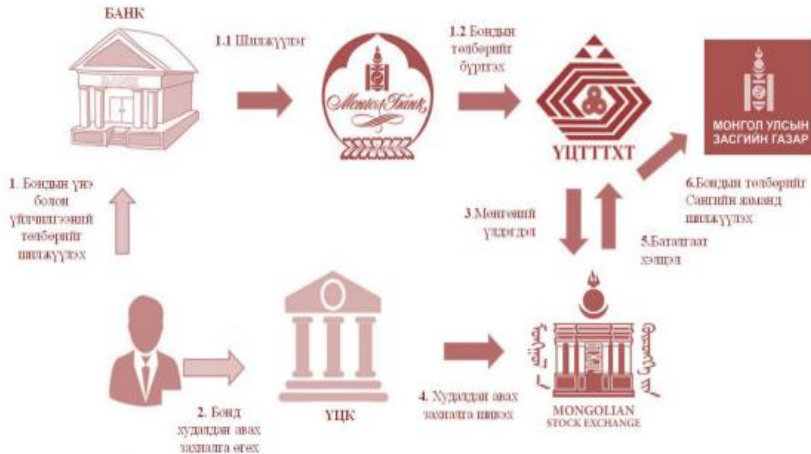
Зураг 1.7. Засгийн газрын бонд худалдан авах үйл явц